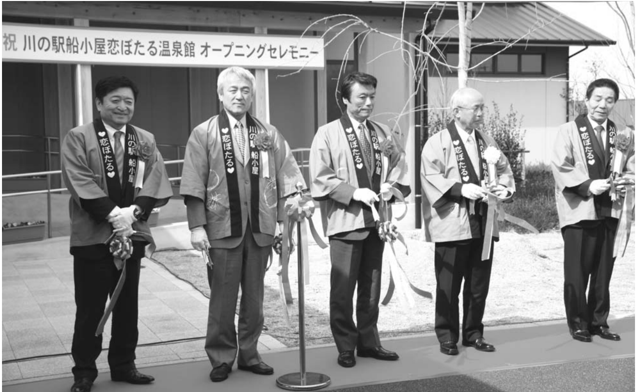
川の駅船小屋「恋ぼたる温泉館」オープニングセレモニー