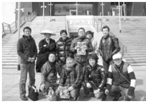
2日目の鹿児島中央駅では一番街は商店街の理直なお話を伺い、こち

筑後市と人口も類似して おり新幹線駅がある出水市 では、約1年間かけて開発 したご当地グルメ「出水親 子ステーキご飯」の開発秘 話や震災での影響、年間8 500食を売り上げた情熱 など、現在様々な企画を行っ ている筑後船小屋駅活性化 への大きなヒントとなりま した。