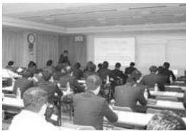
実際に会った交流親睦が図られた、大変有意義な勉強会となりました。

今回も、JAふくおか八 女筑後地区青年部、筑後J Cの皆様にもご参加頂き、 総勢70名以上で筑後YEG ホームページとブログ、ツ イッター、Facebookと連携し た、より実践的な使い方を 勉強することが出来ました。 ネットでのつながりに加え