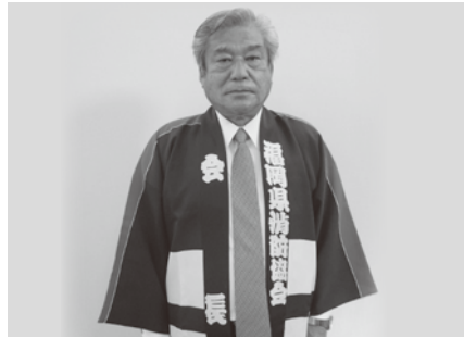
消防協会会長法被を羽織られた角副会頭

角副会頭は、昭和46年4月に筑後市消防団員を拝命されて以来、50年の永きにわたり、仕事に従事されながら、強い責任感を持って、消防団活動に精励されてこられました。