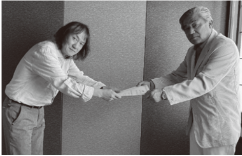
角副会頭より委嘱状を交付