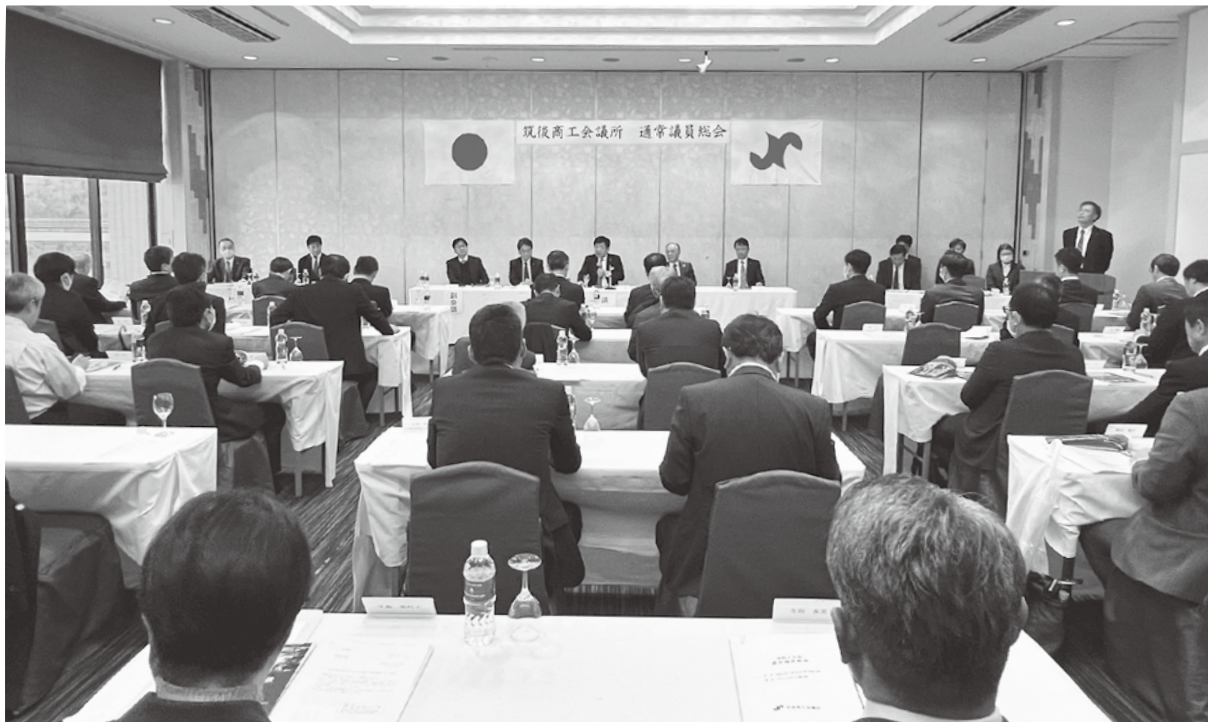
通常議員総会(令和6年3月25日)会場:グランドホテル樋口軒