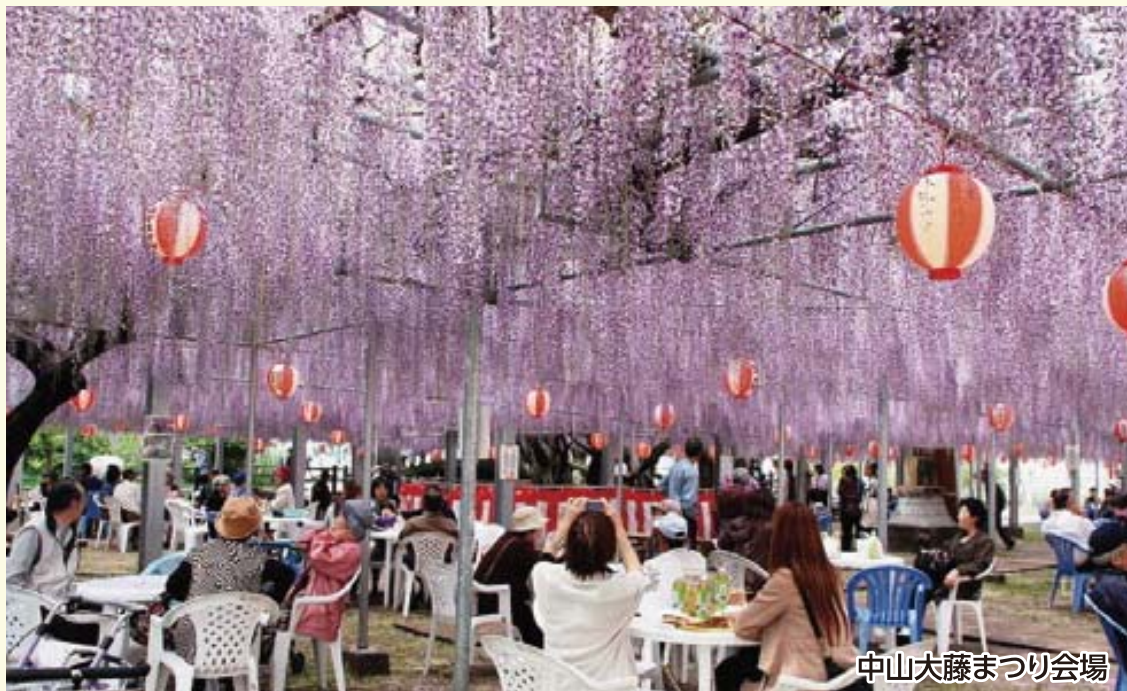
中山大藤まつり会場

創業120年の酒蔵で試飲と酒の文化を学びましょう。樹齢約300年・広さ1,200㎡の藤棚は県の天然記念物に指定され、かぐわしい香りが一面に広がります。最後は、JR九州とタイアップした「九州芸文館」でのイベントをお楽しみください。